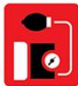
Артериальная гипертензия и атеросклероз